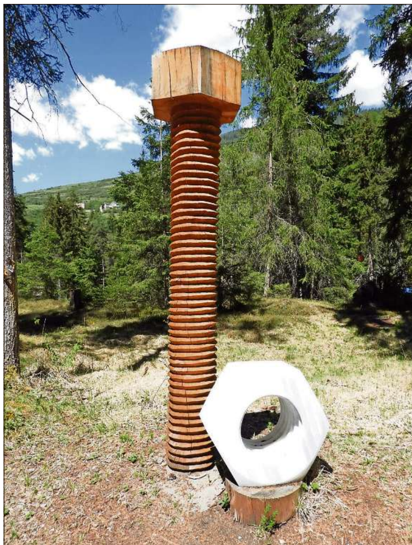
Eir ingon han ils partecipants la pussibilità da cumbinar lain e cun marmel da Laas.

Ils responsabels dal Simposi internaziunal da sculpturas mettan a disposiziun a las ar-