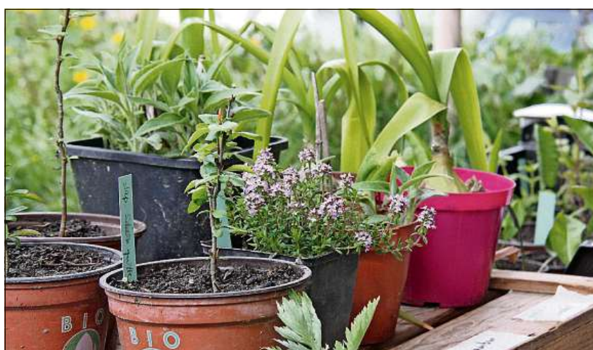
Cultivar semenza ei iu empau en emblidanza, il hortulan da hobi cumpra plantinas.