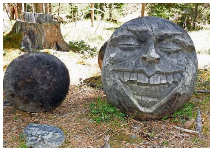
Eir ouvras da lain sun expostas lung la Senda da sculpturas.