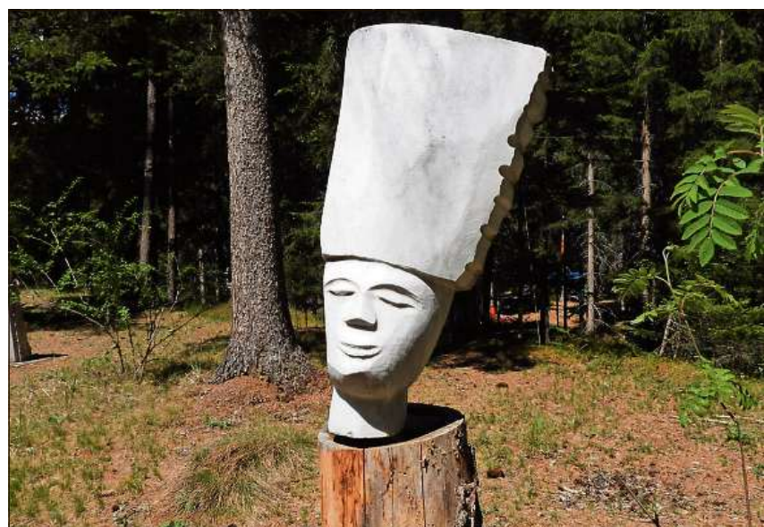
120 ouvras imbellischan la Senda da sculpturas a Sur En.